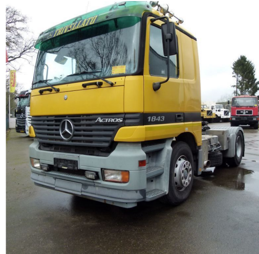
Mercedes-Benz Actros 1843 LS Actros - 4x2