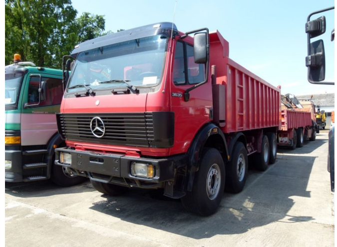
Mercedes-Benz SK - 3635 K - 8x4