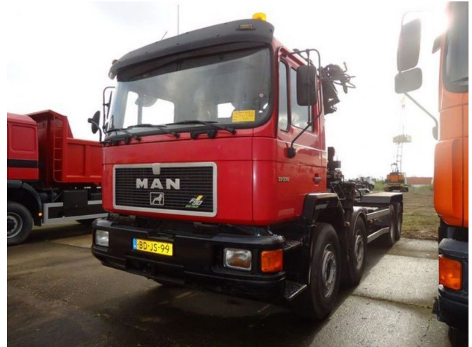
MAN 37.372 8x4 HIAB195