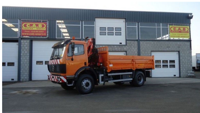
Mercedes-Benz 1820 AK 4x4