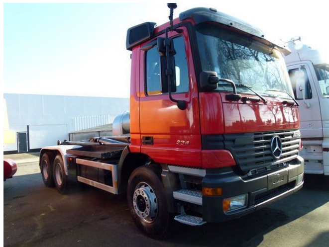
Mercedes-Benz 2640 K Haaksy... 6x4