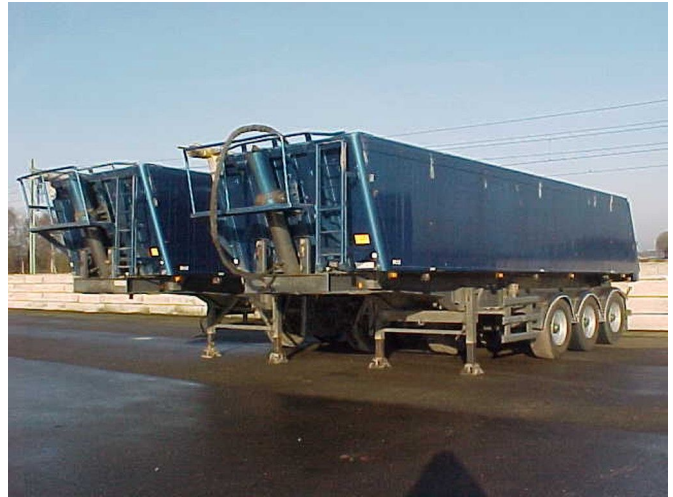
Stas 2 Trailers / Alu - 33M3