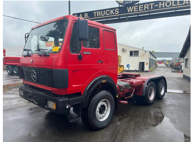
Mercedes-Benz 2644 - V8 6x4