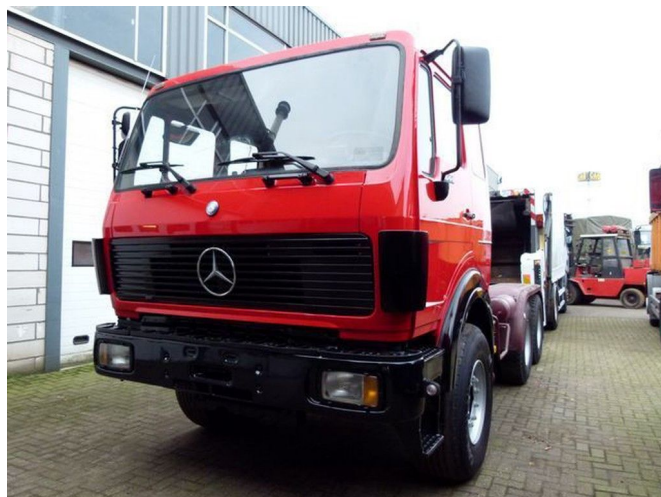
Mercedes-Benz SK 2644 - V8 6x4