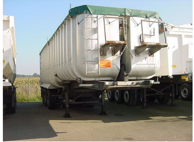
CRANE-FRUEHAUF 04 DA / Aluminium