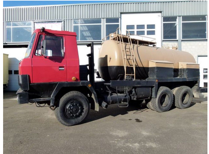
Tatra 815 P 13 - 6x6