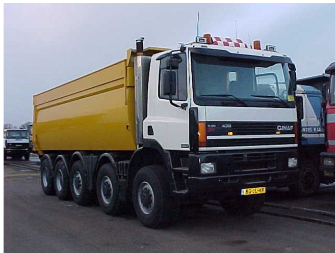
Ginaf M 5450 10x8