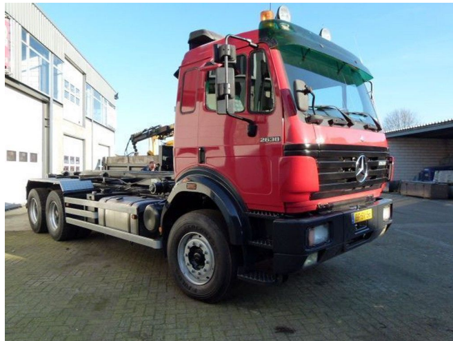
Mercedes-Benz 2638 K / 6x2