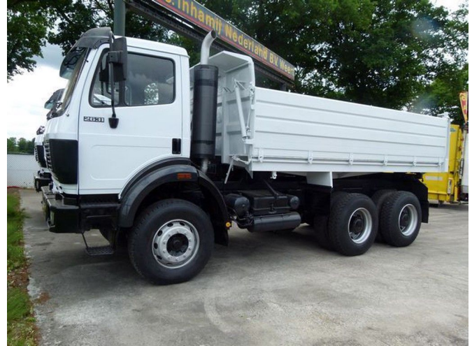
Mercedes-Benz SK 2631 K / 6x4 STEEL SPRINGS