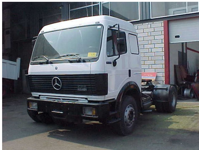
Mercedes-Benz SK 1948 1948 S / 4x2 / V8- EPS with 3 pedals