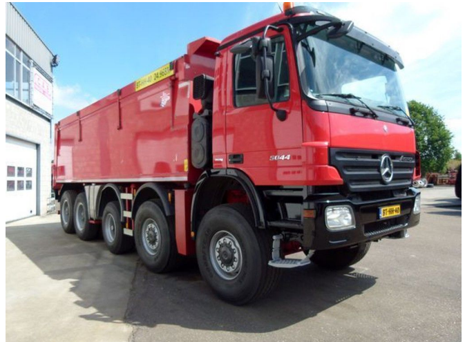
Mercedes-Benz 5044 AK Actros - 10x8 - Euro 5 - Telligent - 3 ...