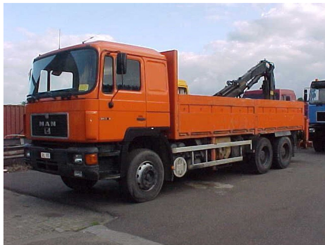
MAN 26.422 6x4 + Crane TIRRE