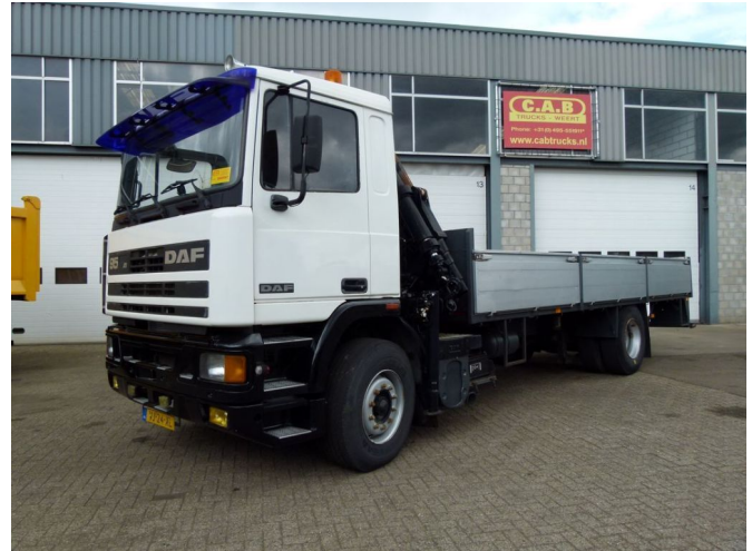
DAF 95.350 - 4x2 - Crane Pesci