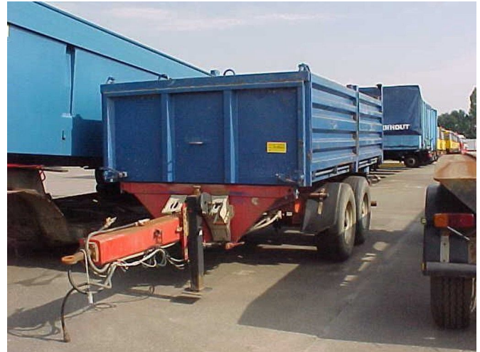
Muller Mitteltal KA-TA18 / 2 Axles