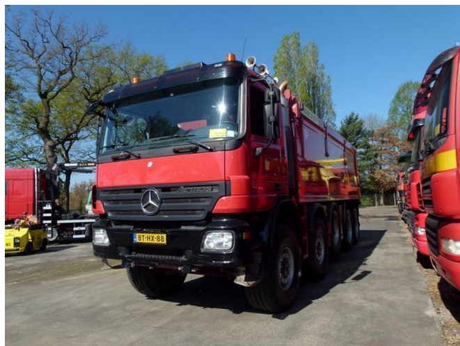
Mercedes-Benz Actros 5044 AK - 10x8 - EURO 5 - TELLIGE...