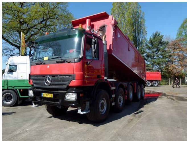
Mercedes-Benz Actros 5044 AK - 10x8 - Euro 5 - Telligent - 3 ...