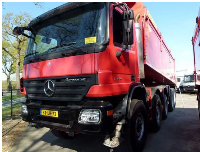
Mercedes-Benz 5044 Actros AK - 10x8 - Euro5 - Telligent 3 p...