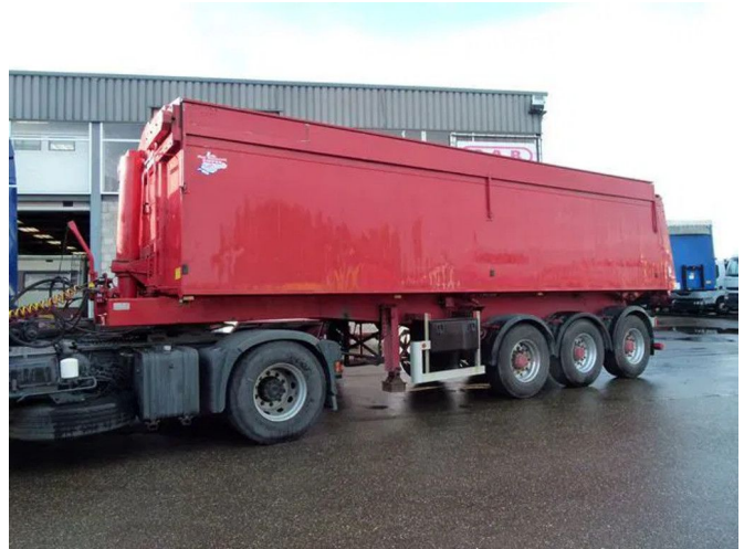
ATM OKA 15/27 - 30M3