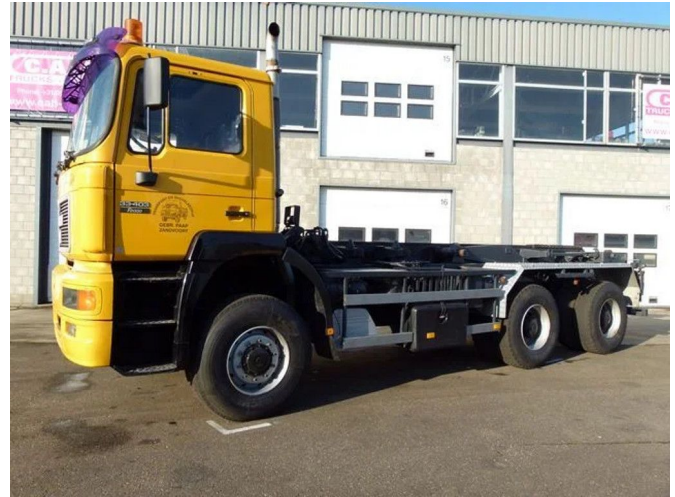
MAN 33.403 33.403 6x6 kettingsysteem