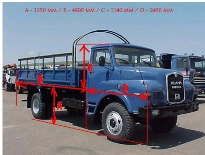
MAN 11.136 - 4x4 CARGO - more pieces in stock