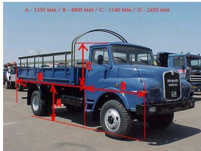
MAN 11.136 - 4x4