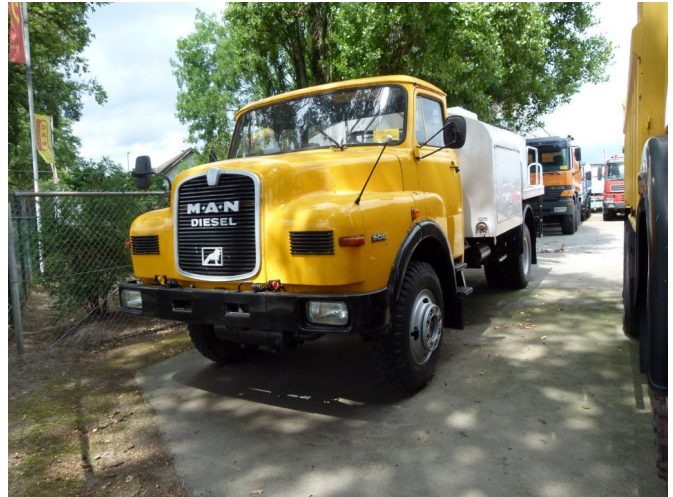
MAN 11.136 Fuel tanker - 4x4