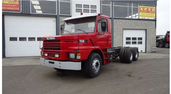
Scania T112 112 E - 6x4