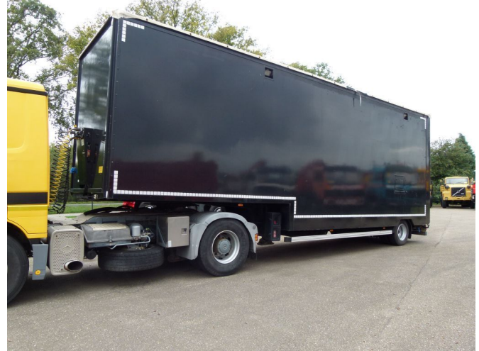
ASCA Closed, tarpaulin cover