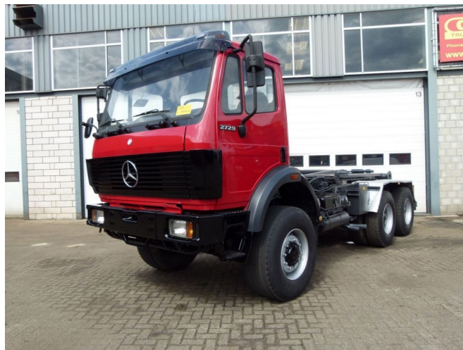
Mercedes-Benz SK 2729 AK - 6x6 - HAAK/HOOK