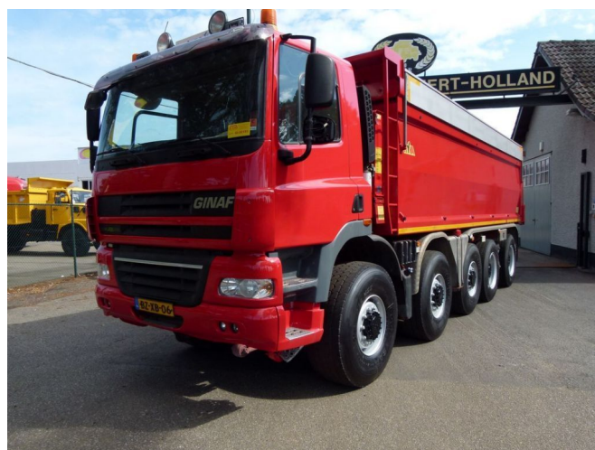
Ginaf X 5450 S - 10x8 - Asfaltkipper MANUAL GEAR