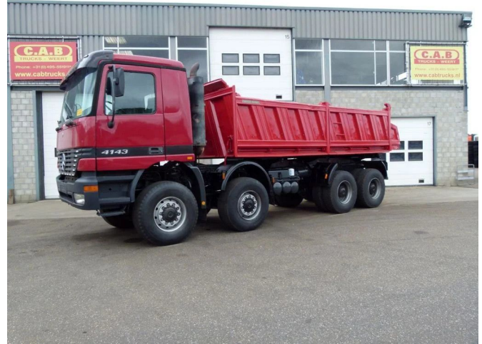
Mercedes-Benz 4143 AK - 8x8