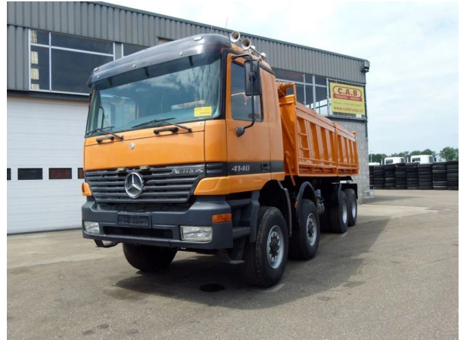
Mercedes-Benz 4140 Actros - 8x8 RESERVED - RESERVED