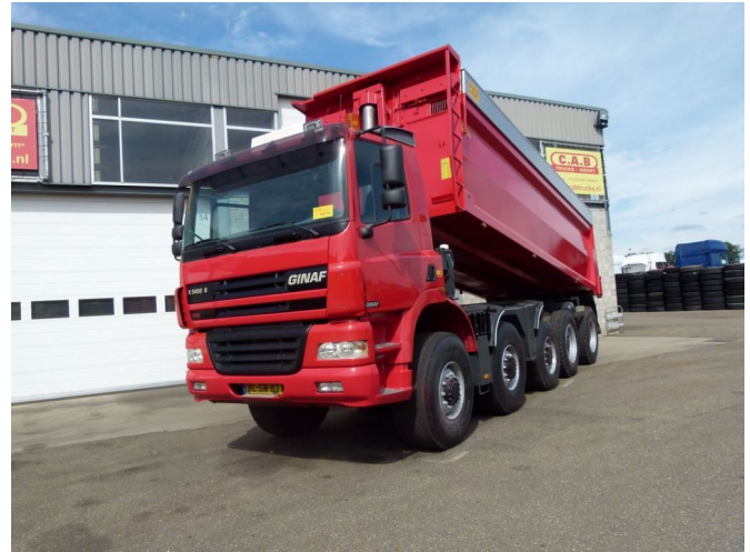
Ginaf X 5450 S - 10x8 MANUAL GEAR