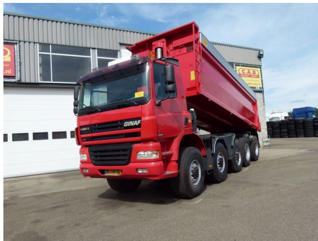
Ginaf X 5450 S - 10x8 MANUAL GEAR