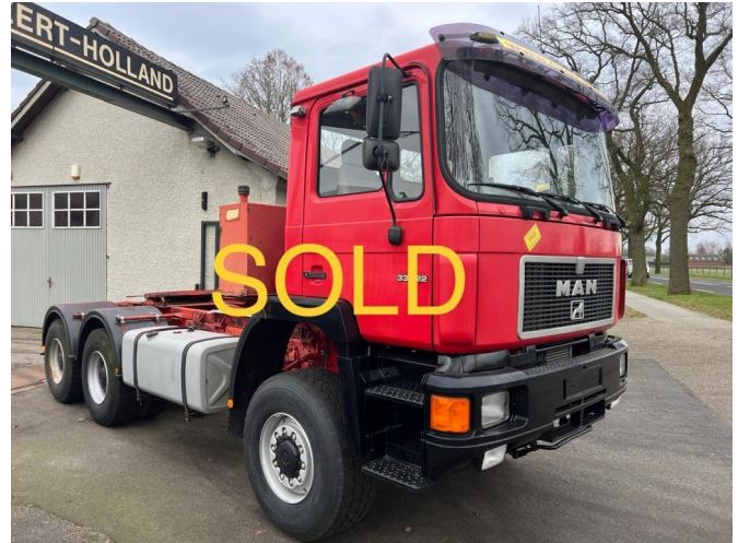
MAN 33.422 6x6 Hydraulique SOLD SOLD