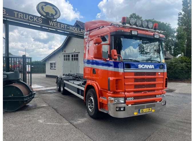
Scania V 8 144.460 MANUAL GEAR RESERVED GER... 6x2