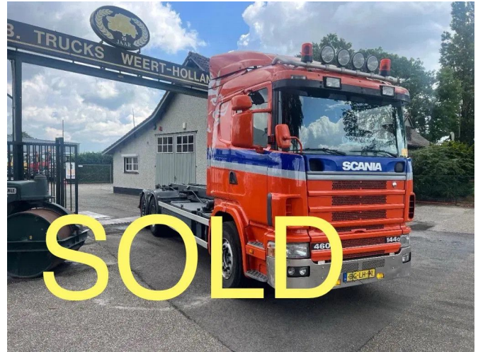
Scania V 8 144.460 MANUAL GEAR - SOLD - VENDU 6x2