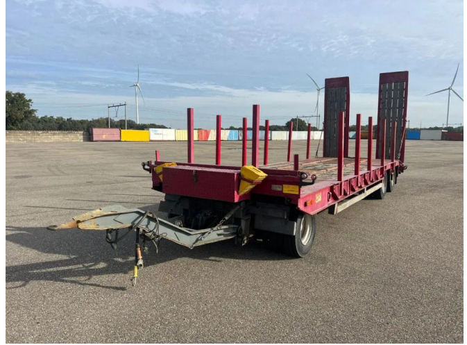
ATM 3 asser bladgeveerd APK t/m 26-2-2026