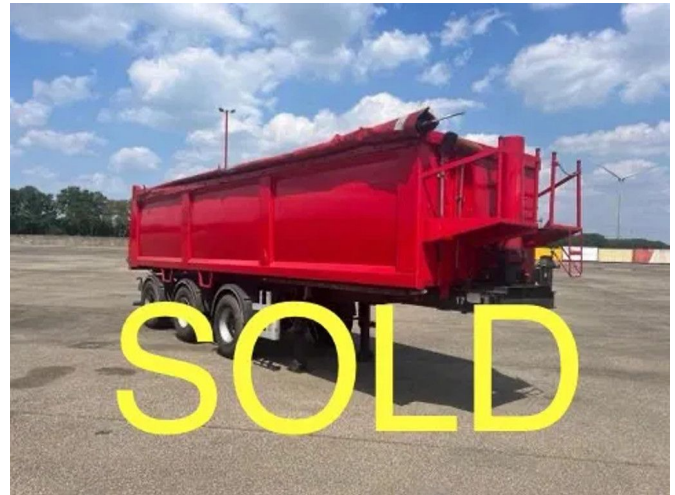
ATM 15-30 met oprolzeil - 2 Assen gestuurd - Liftas - SOLD - ...