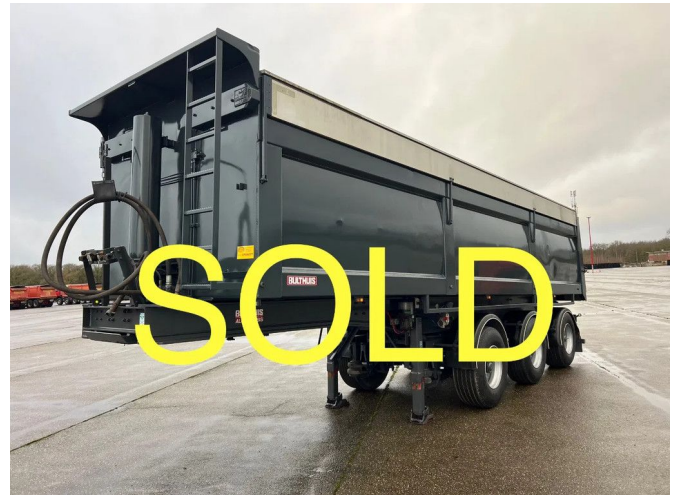
Bulthuis TATA 23 - voorzien van hydraulische milieukappen - 2...