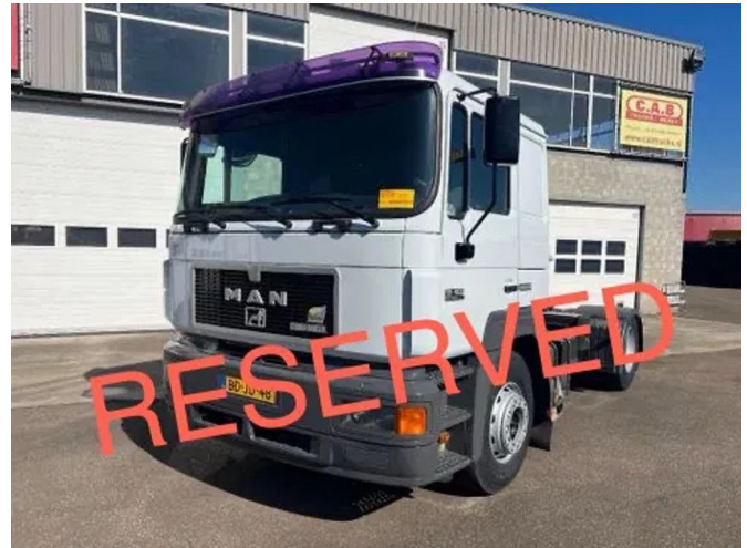
MAN 19.403 F2000 Met kiphydrauliek - manual gearbox... 4x2 Referentienummer: MA980241