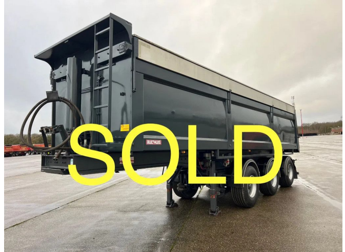
Bulthuis TATA 23 - voorzien van hydraulische milieukappen - 2...