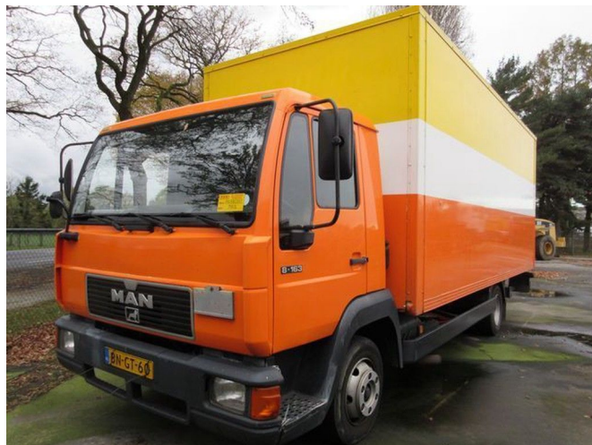
MAN 8.163 8.163 - L2000