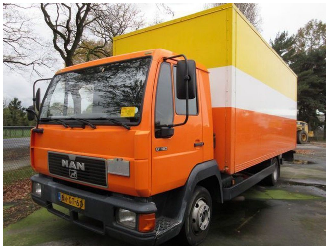
MAN 8.163 8.163 - L2000