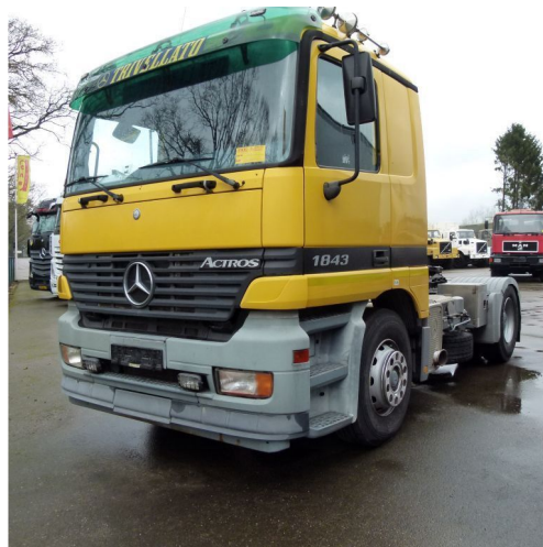
Mercedes-Benz Actros 1843 LS Actros - 4x2