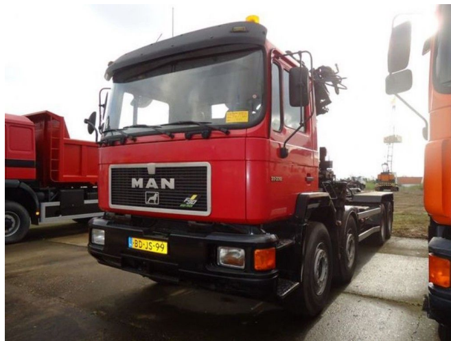
MAN 37.372 8x4 HIAB195