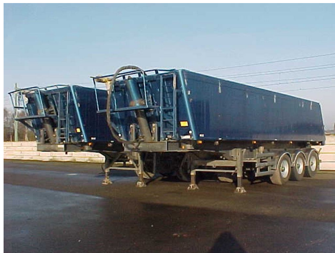
Stas 2 Trailers / Alu - 33M3