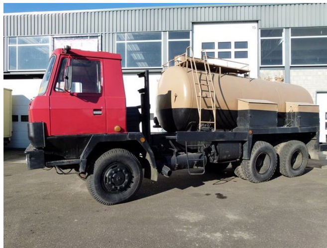
Tatra 815 P 13 - 6x6