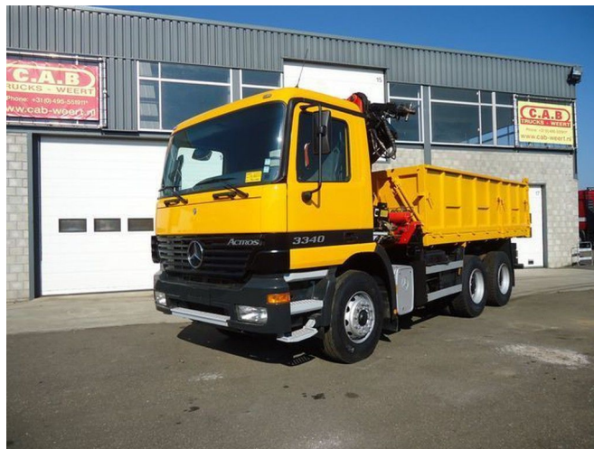
Mercedes-Benz Actros 2640 - 6x4 - ...