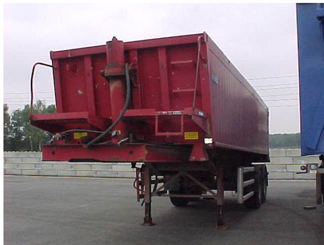
Renders ROC 16.20S - Aluminium